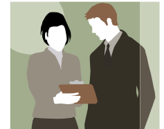
総務省 「平成24年度就業構造基本調査」

平成24年度就業構造基本調査によると、就業者に占める女性の割合は44.4%で18位、同じく管理職に占める割合は13.4%で22位、起業家に占める割合は14.7%で9位となっています。