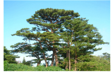
県木 リュウキュウマツ

世界でも珍しい一属一種のキツツキ科の鳥で、沖縄本島北部だけに生息しており、国の特別天然記念物に指定されている。