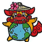
大会マスコットキャラクター 笠丸(かさまる)