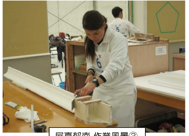
屋嘉郁南 作業風景③