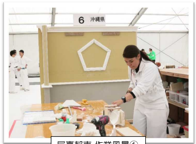
屋嘉郁南 作業風景①