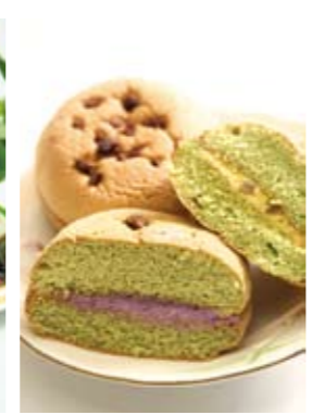
オクラや紅芋、ドラゴンフルーツなどの地元食材を使ったスイーツ「やえっせ」