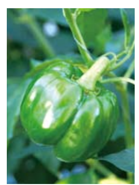
味と品質に絶対の自信を持つ八重瀬産ピーマン

も、県農業改良普及センター技師や農協営農指導員など、十名のメンバーが揃っています。