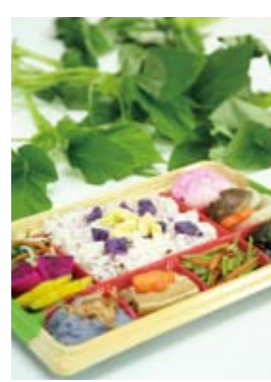
「ぐしちゃんいい菜」や「ハワイ芋」を使ったヘルシーなご当地弁当