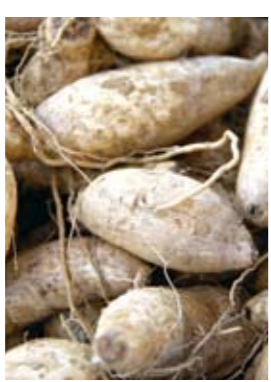
糖度の高い紅芋「ハワイ芋」