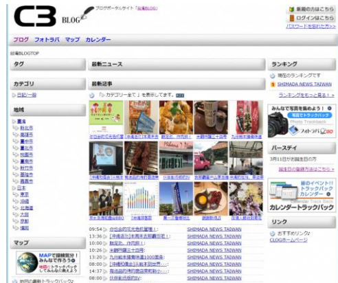
■ 台湾ブログポータル(繁体中文)展開