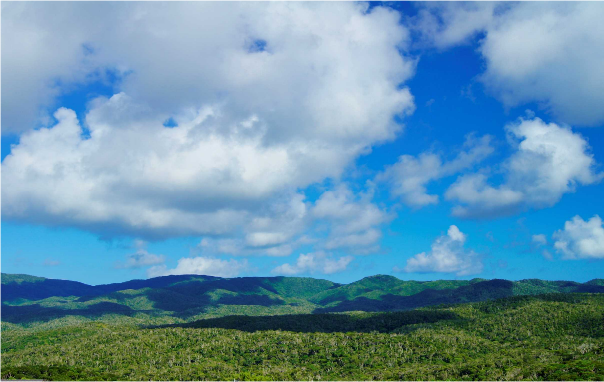
やんばるの森（国頭村）