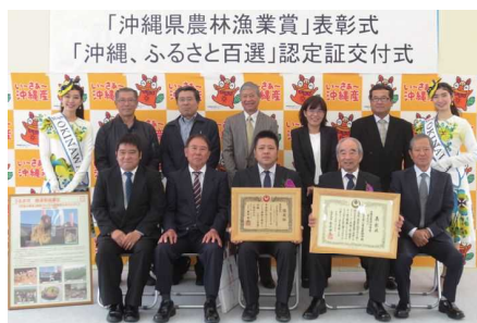
「沖縄県農林漁業賞」表彰式 「沖縄、ふるさと百選」認定証交付式 勝連南風原区