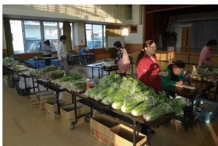
うまんちゅかつちん朝市