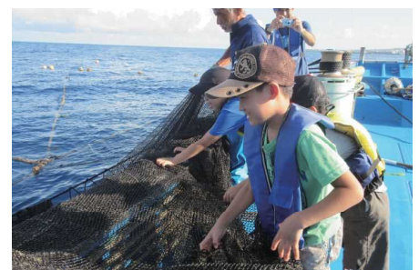
都屋漁港定置網漁体験