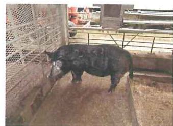
沖縄在来豚アグー