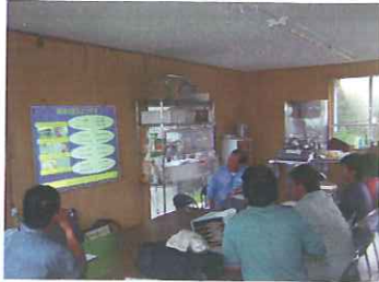
畜産経営改善・指導