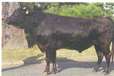
基幹種雄牛「北福波」