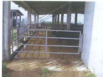
生産基盤整備状況