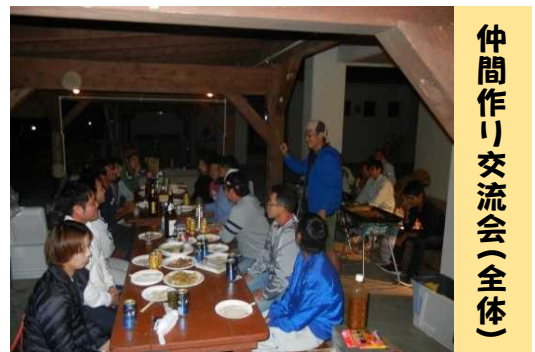
仲間作り交流会(全体)

北部地区青年農業者連絡会議事務局 (北部農林水産振興センター農業改良普及課内) TEL：0980-52-2752