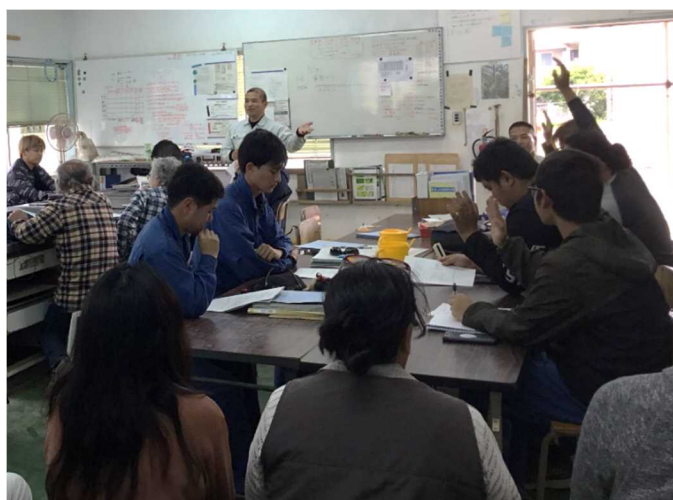
4 在校生からも積極的な質問