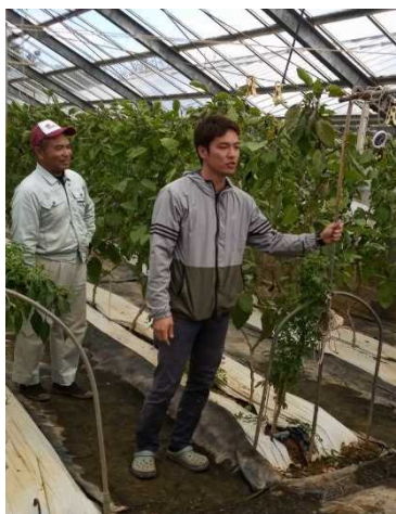
1 学生によるハウス説明

また、就農5年目くらいは、将来について考え悩む時期だそうです。参加してくれた卒業生たちも、農業者になって気づいた疑問、質問を確認する良い機会になったと思います。