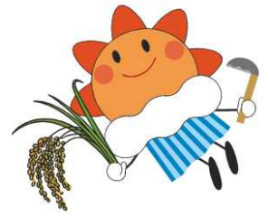
気象庁マスコットキャラクターはれるん

気象庁ホームページでは、農業に役立つ気象情報をまとめた「農業気象ポータルサイト」を公開しています。農業と気象の関係の特性を踏まえ、下記の内容を掲載しています。