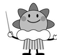
気象庁マスコットキャラクター はれるん