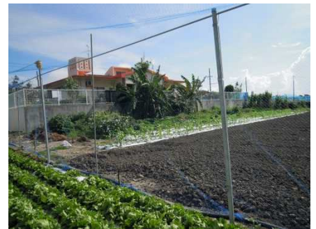
図4 防鳥ネット設置状況(糸満市)