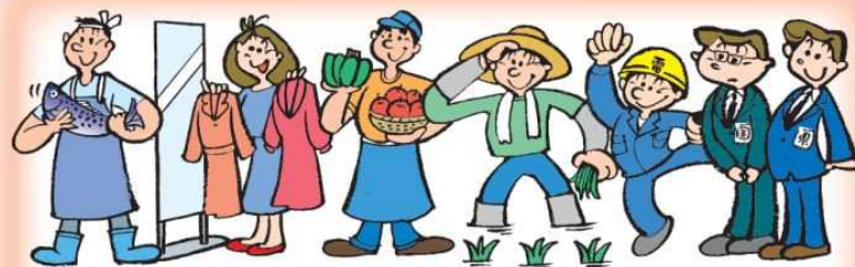
季節予報は、営農計画、電力供給、製造・販売業などの様々な社会・経済活動に利用されています。

季節予報は様々な社会・経済活動で利用されており、例えば、天候の影響を大きく受ける農業においては、栽培品種の選定、作付等の農事計画、収穫期の予測等に、また、製造業では商品の企画、原料・資材の手配、生産需給、販売計画等に活用されています。