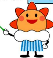
気象庁マスコットキャラクターはれるん

季節予報は様々な社会・経済活動で利用されており、例えば、天候の影響を大きく受ける農業においては、栽培品種の選定、作付等の農事計画、収穫期の予測等に、また、製造業では商品の企画、原料・資材の手配、生産需給、販売計画等に活用されています。