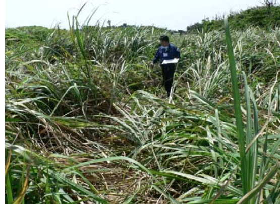
倒伏したサトウキビ