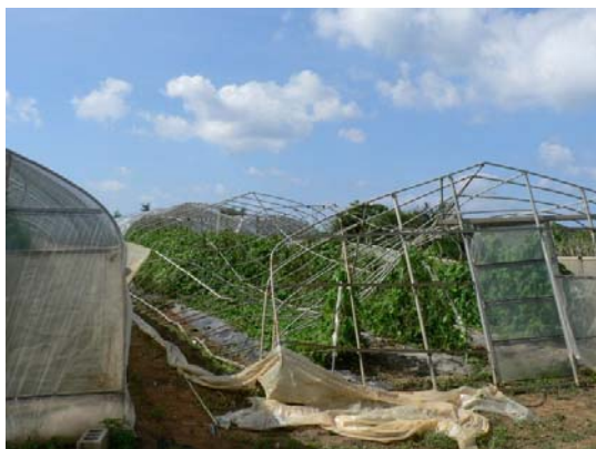
倒壊したビニールハウス

平成19年4月18日午前8時頃、宮古島市では、竜巻による局地的な突風があり、ビニールハウスの倒壊や剥離、サトウキビの倒伏などの被害が発生しました（下写真：4月19日撮影）。