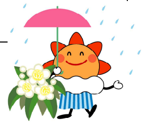
気象庁マスコットキャラクター はれるん