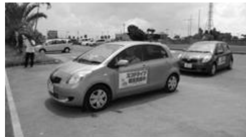
エコドライブ教習会