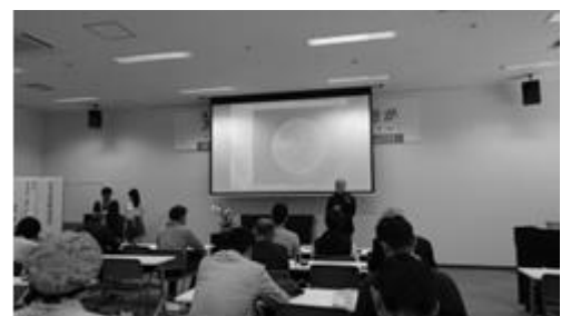
沖縄県地球温暖化防止活動推進員研修

地球温暖化防止活動推進センターは、地球温暖化対策推進法第38条に基づき、各都道府県に1か所、知事により指定される機関で、本県では、平成15年11月に（一財）沖縄県公衆衛生協会を「沖縄県地球温暖化防止活動推進センター」として指定しました。