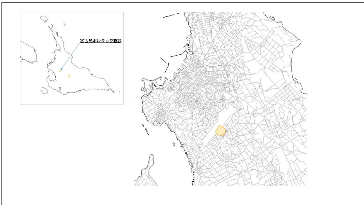
図 83-1 宮古島ボルタック施設の位置図（昭和47年時）

( http://www.mofa.go.jp/mofaj/area/usa/sfa/kyoutei/pdfs/02_03.pdf ) を参照