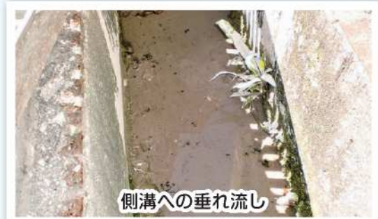
側溝への垂れ流し