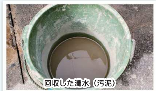
回収した濁水(汚泥)