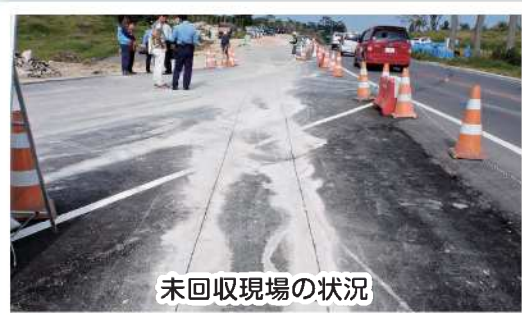
未回収現場の状況

適正に回収し、産業廃棄物処理業者に委託するなどして、適正に処理する必要があります。また、通常の産業廃棄物と同様に排出事業者には manifests の交付義務が適用されます。故意に河川等に垂れ流している場合は、廃棄物処理法に基づき罰せられる事もあります。