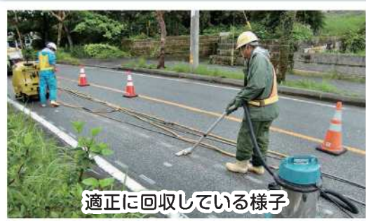
適正に回収している様子