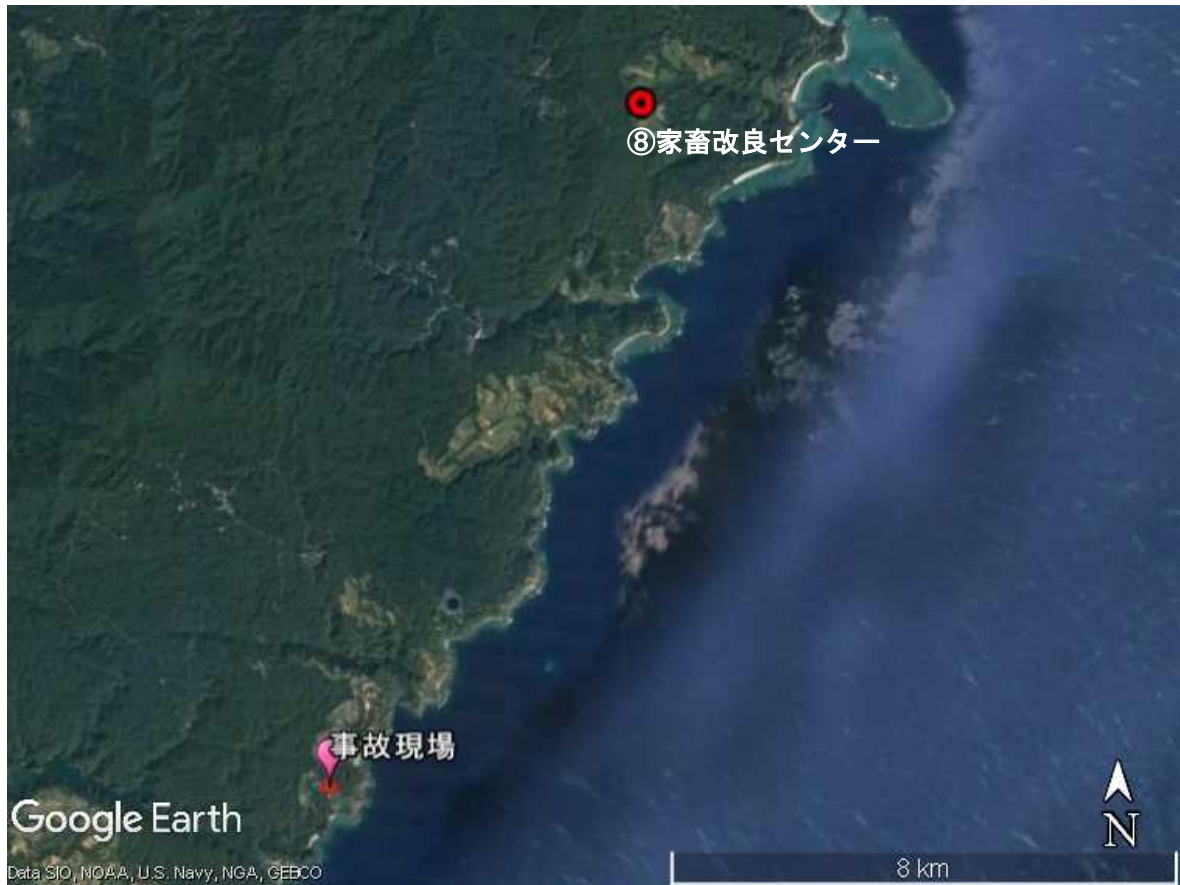
図2. 事故現場と比較対象地点である家畜改良センターとの位置関係