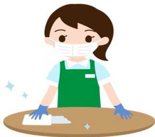
よく触れる場所の消毒