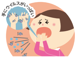
咳やくしゃみを手でおさえてしまったあと