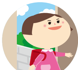
外から帰ったあと