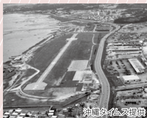
返 還 前