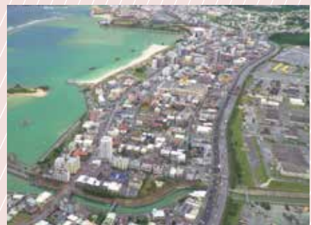
返 還 後