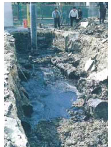
北谷町美浜の米軍基地返還跡地の地中から、ドラム缶に入ったタール状物質が多数発見された。(平成14年1月)

沖縄県では、航空機騒音の軽減や深刻な環境被害の未然防止等のため、米軍にも日本の国内法を適用させることなどを国に対して求めています。