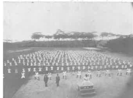
沖縄県立第二中学校全校生徒の集団練習(『空手道大観』(1938年)掲載)