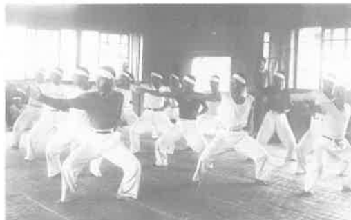
沖縄県師範学校生徒(1932年) 熊本県立図書館所蔵、野々村孝男「写真集 懐かしき沖縄」琉球新報社(2000年)掲載