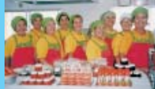
“きむたか加工所”のメンバー