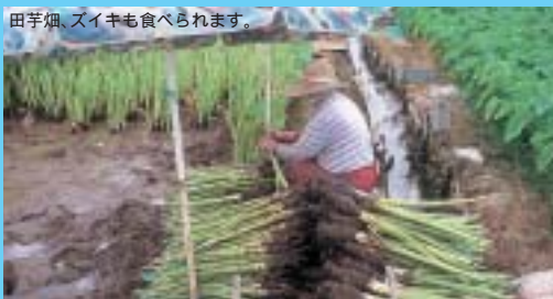
田芋畑、ズイキも食べられます。

「なかとみ」の田芋パイはサククリとしたパイ皮に、あっさり感のある素朴な感じの甘さがあり、田芋のあんをたっぷり包みこんで揚げたのが特徴で人気の秘密になっている。(宜野湾市)