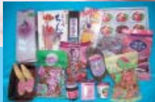
【“紅加工所”と 紅芋商品】