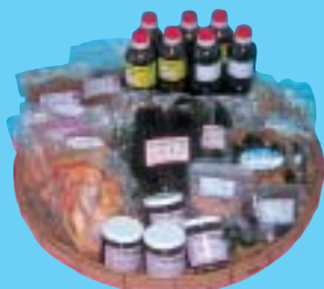
【ソデイカ、シーラ、ヒジキの加工品】