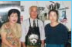
【I R I N A】