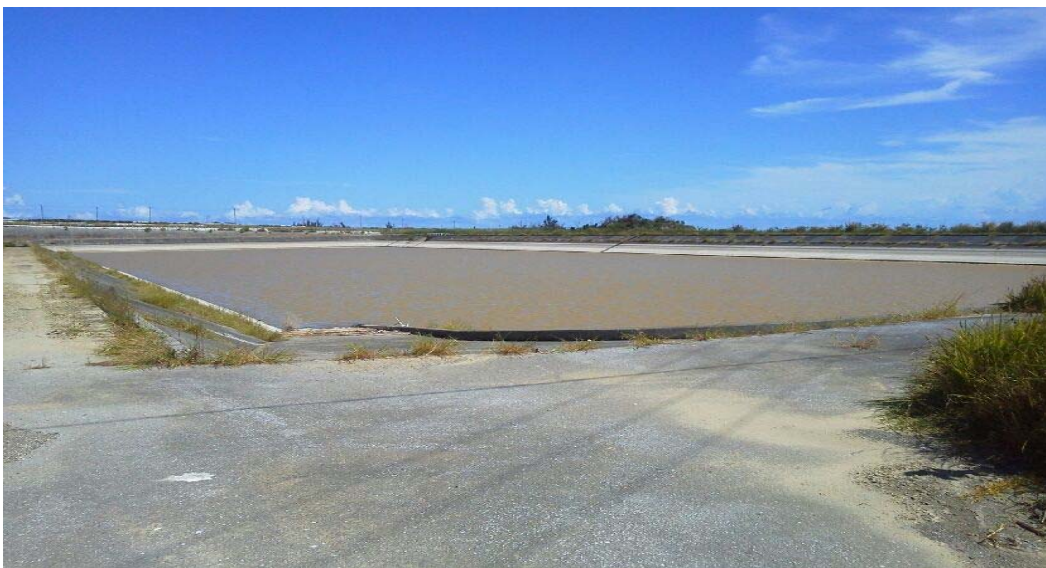
貯水池の状況(宮城島)