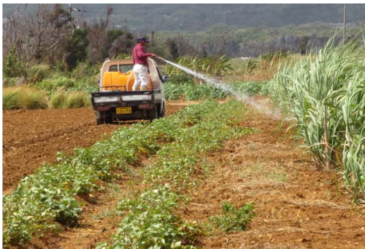
軽トラックによる散水状況 (与勝地下ダム又は宮城島貯水池より給水)