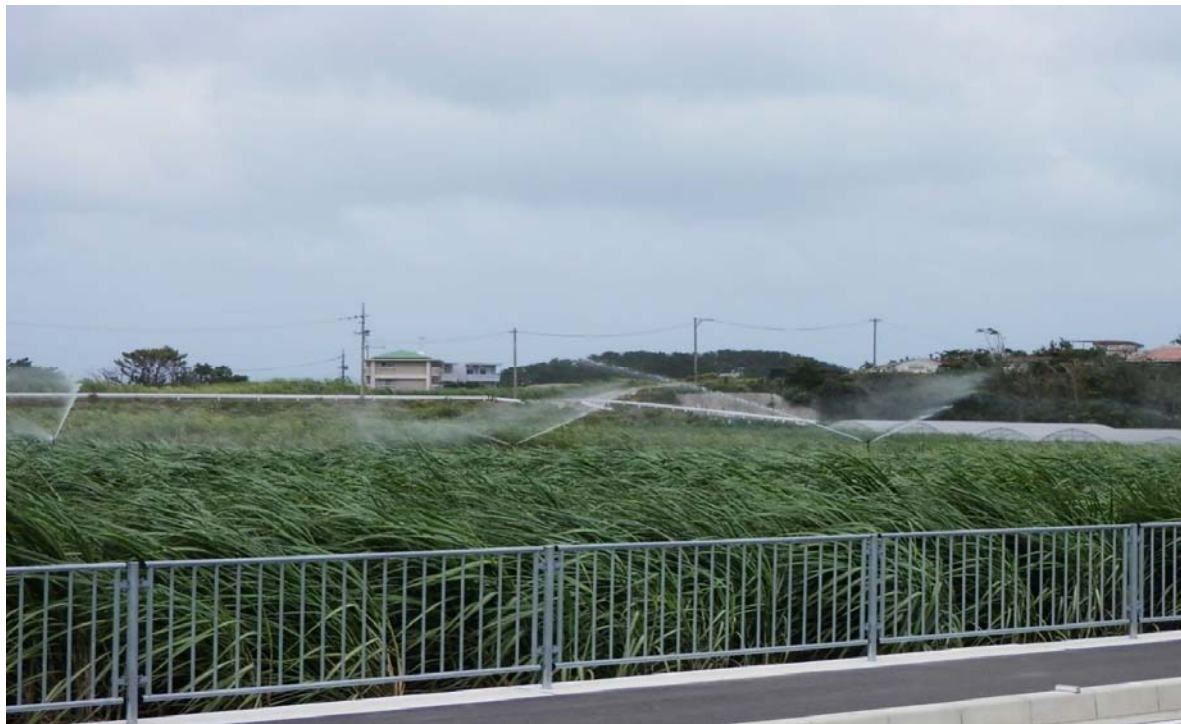
スプリンクラーによる散水状況