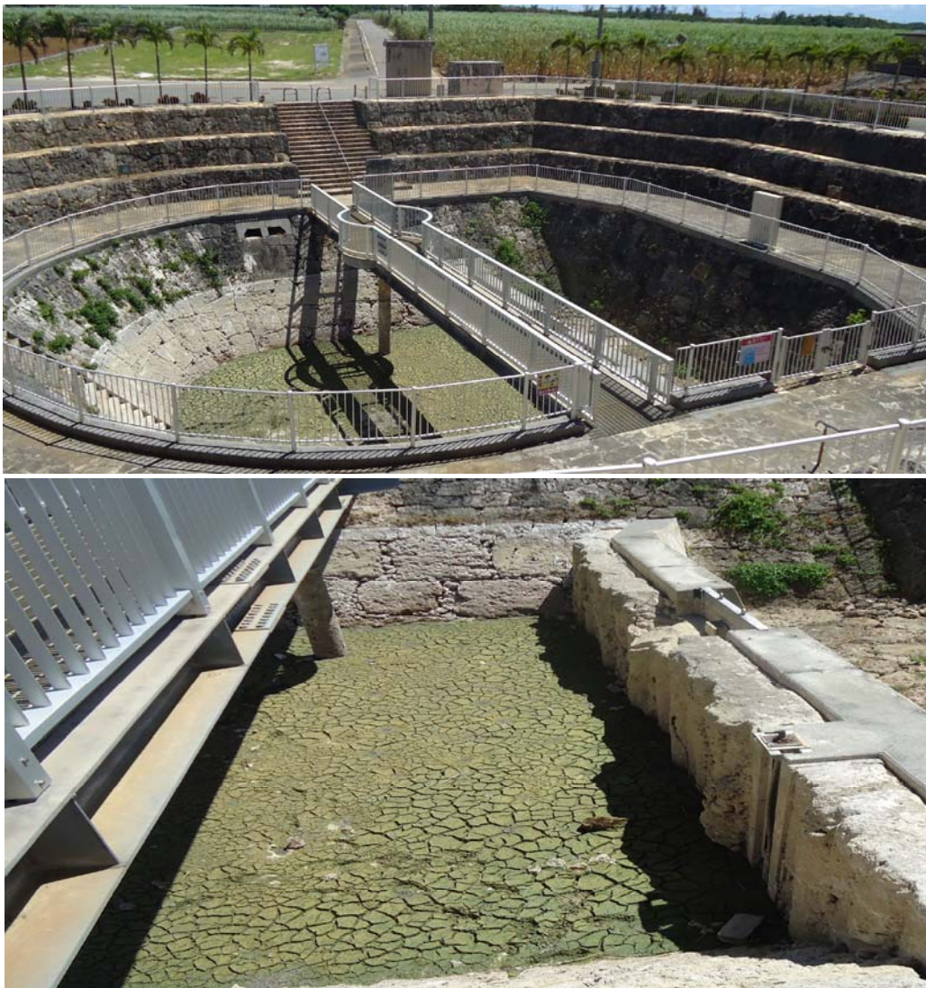
地下ダム: 地表水面の低下状況