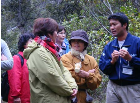
森林散策(エスコーターの話に聞き入る)

命薬の森に癒される2日間 in森林セラピー ～森と水とやすらぎの里くになみ～（国頭村）