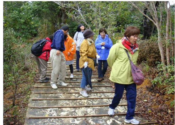
散策道を行く参加者のみなさん