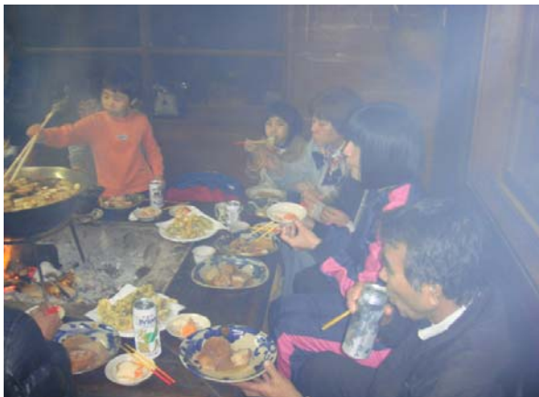
囲炉裏をかこんで夕食