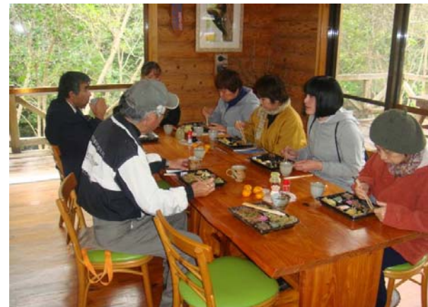
地元食材のランチをゆっくり楽しむ