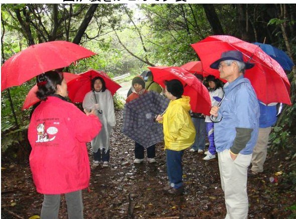
林道散策(エスコーターの話に耳を傾げる)