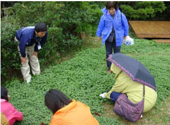
野草と四つ葉のクローバー探し