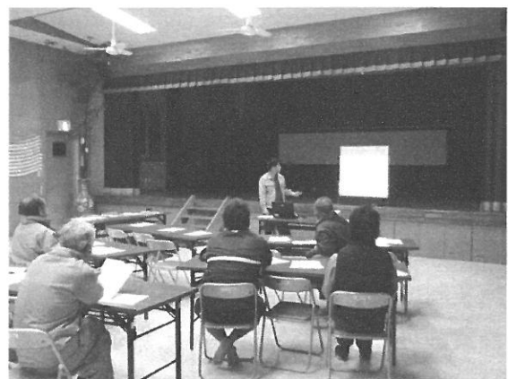
西表白浜地区における説明会