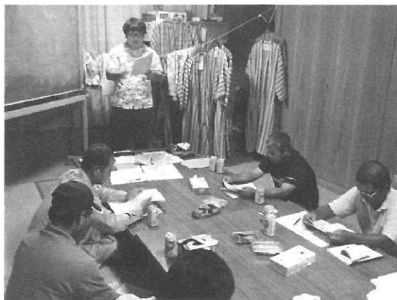
西表大原地区における説明会