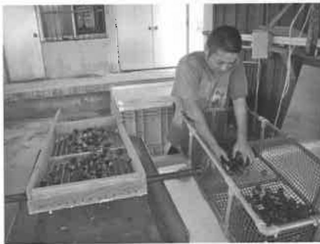
図2 スリット式サイズ選別機

なお、業務筋は1キロパックで価格を抑えて流通させ（価格は未定）、魚しげの持つ県内居酒屋ネットワークに卸すので、本県産貝類の流通がインド洋のバイに少しでも対抗できることを期待する。