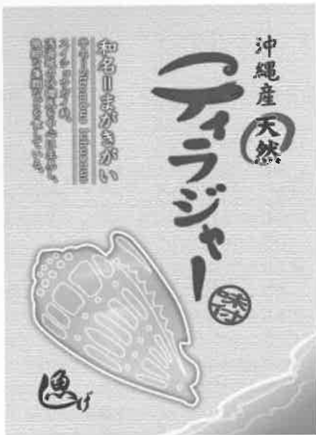
図1 パッケージデザイン