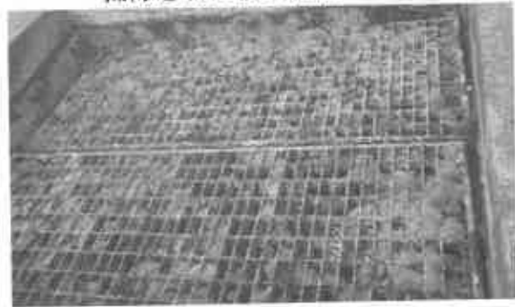
掃除されて無い柵の状況

後とも、現場での効率的な処理法の開発が必要である。現状のままでは、掃除のできる半分づつを、隔年での取り上げも試みる必要がある。