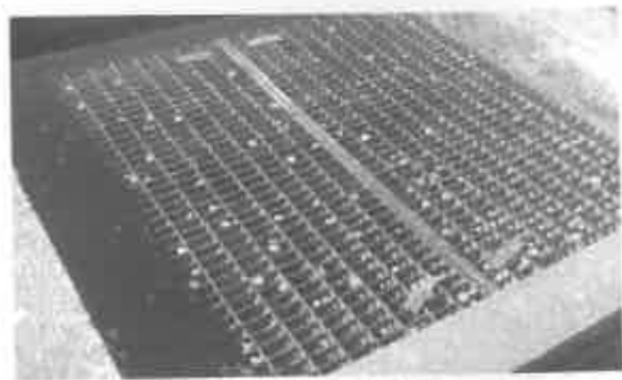
掃除された柵の状況