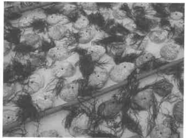
④コレクター上の母藻