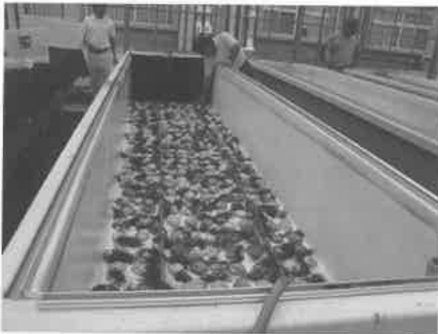
③干出処理した母藻をコレクター上に投入