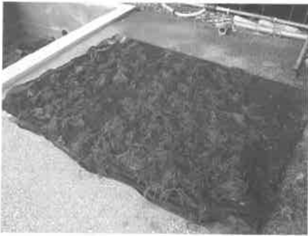
①クビレオゴノリ母藻の干出処理