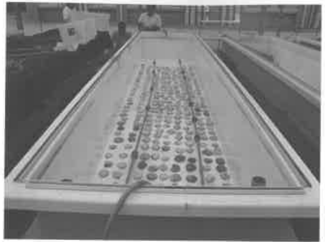
②貝殻コレクターの配置