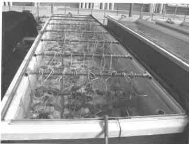
⑤作成したコレクターの垂下連