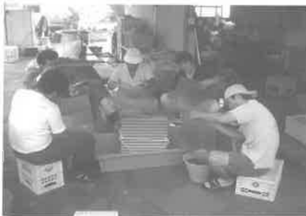
⑦稚ウニの波板からの剥離作業