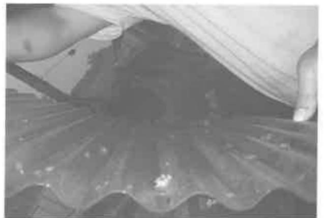
⑧剥離時に波板に付着していた稚ウニ