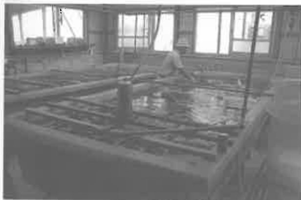
⑤稚ウニの波板飼育水槽