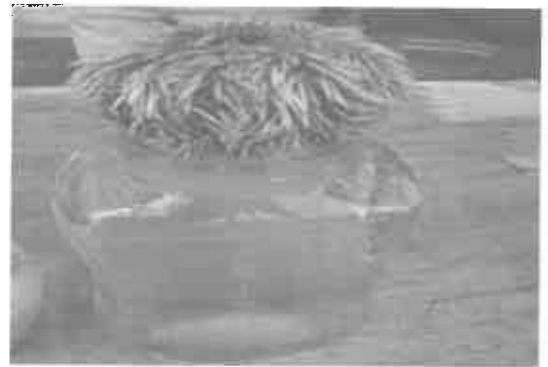
②KCL刺激で産卵した親ウニ