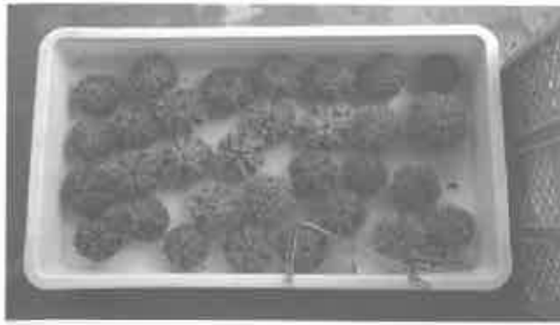
①採卵に使用した天然親ウニ