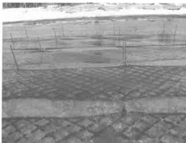
平成17年1月25日時点でのヒトエグサ

平成17年1月25日ヒトエグサの生育状況を確認したところ、まばらではあるが心配していたよりも多く生えていた。