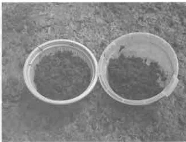
収穫したヒトエグサ

平成17年3月31日に2回目の収穫を行った。つみ取りは3名1回目と同じくハサミを使用。網15枚から30キロ収穫