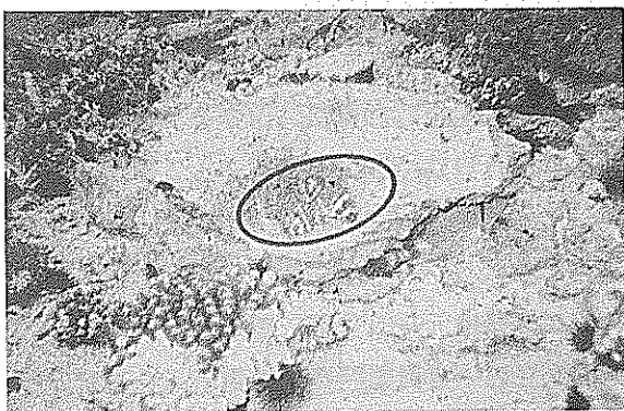
育成礁外で確認した育成タカセガイ