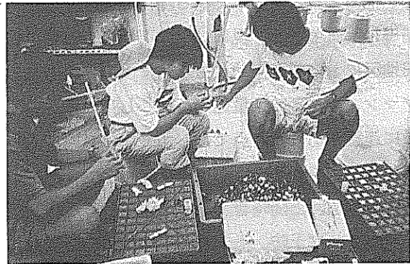
放流用種苗にマーキングを行う。