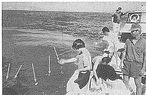
育成種苗放流作業 今回は、船上からの投入と潜水して定着させる方法を採用した。