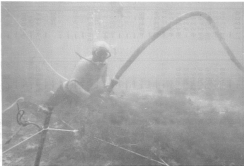
ポンプによる収穫作業