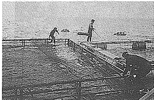
読谷村漁協浮沈式生簀 (マダイ・タマン)