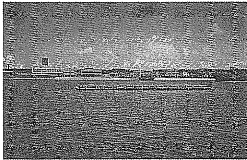
北谷町漁協養殖場