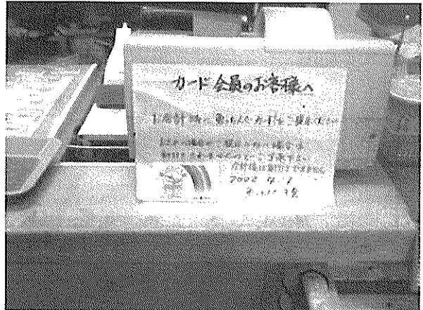
会員カード（魚っちんぐカード）

今後、直売店の経営がうまくいくためにもたくさんの方の地元の人に利用してもらえるような運営の仕組みづくり（直売店のPRや利用者にもメリットが出てくる方法）を考えて行くことが大切だと実感した。仕組み作りを考え行くためにも、平良市漁協や行政のバックアップの必要性を感じた。