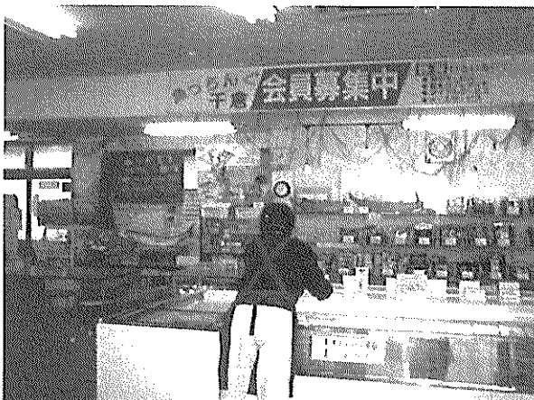
魚っちんぐ千倉店内