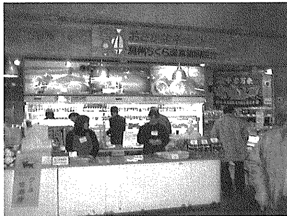
海市場ちくら加工品売り場