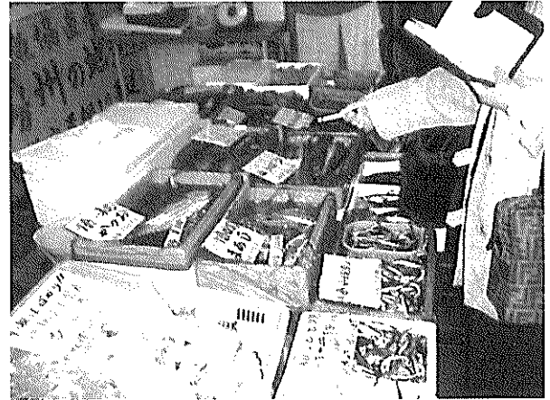
海市場ちくらで販売していた鮮魚