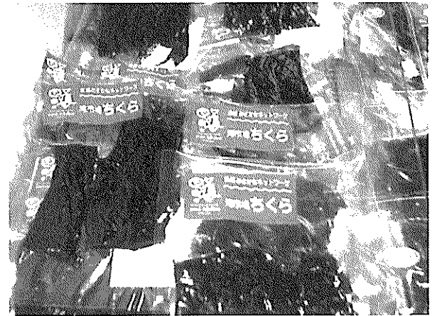
海市場ちくらで販売している加工品