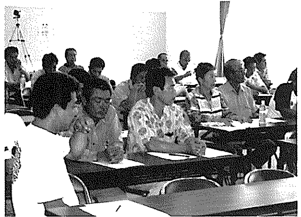
③講演を熱心に拝聴している漁業者の皆さん