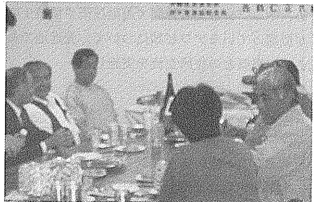
少人数ながら盛り上がる懇親会