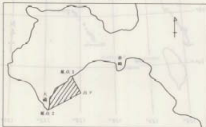
名蔵湾保護水面の位置及び区域