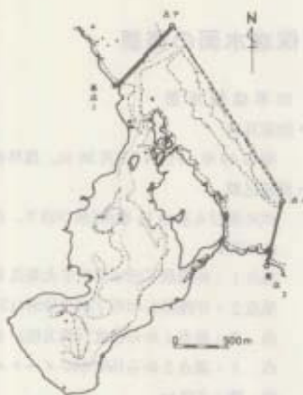
川平保護水面の位置及び区域