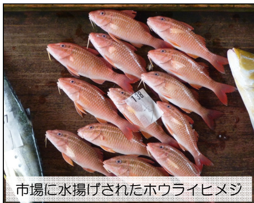
市場に水揚げされたホウライヒメジ

カラフルな見た目をしているので、食べられるの！？と思うかもしれませんが、独特の風味があり、刺身、唐揚げ、天ぷら、煮付け等でおいしくいただけます。沖縄の魚市場では、ポピュラーな魚のひとつで、潜水漁、刺網漁、定置網漁などで漁獲されており、2013年は、沖縄県全体で年間12トンほどの水揚げがありました（沖縄県水産海洋技術センター）。しかしながら近年、資源状態の急激な悪化が懸念されている魚種のひとつとされています。