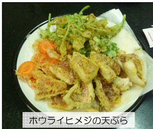
ホウライヒメジの天ぷら