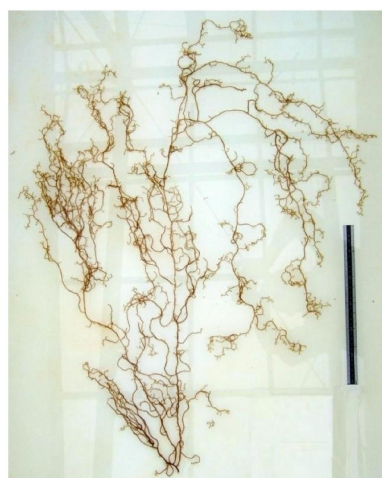
写真1 採集した大型藻体(S-20株) スケール 30cm

試験は人工気象器(SANYO-Growth Cabinet)を使用した。光源には白色蛍光灯を使用し、平面光量子計(LI-COR社 LI-250/LI-192SA)で培養容器の中心付近の光量を測定した。培地は、Von Stosch's Enriched Seawater Medium(以下、VSE培地)の硝酸態窒素濃度を適宜調整し使用した。また