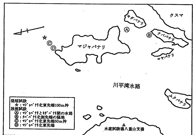
図1 シャコガイ養殖・放流試験場所

図1にシャコガイ養殖・放流試験場所を示した。川平保護水面内においてヒレジャコ、ヒレナシジャコの採卵用親貝の養成、ケージ養殖試験、放流試験を行った。