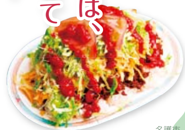
パララー千里の元祖タコライス

ギネス世界一を達成した町は、「タコライスの町宣言」をしてさらに元気に前進中です!