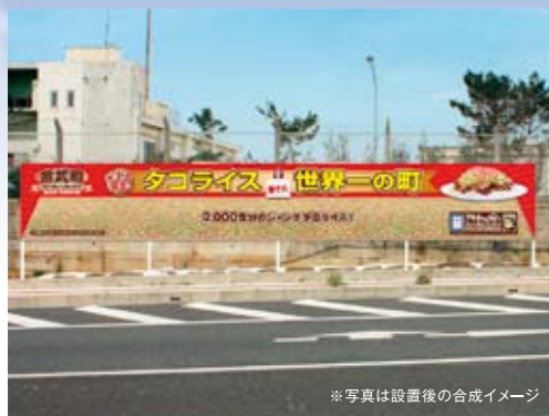
※写真は設置後の合成イメージ ジャンボタコライスと同サイズの看板(横12m×縦1.8m)

本島北部に位置する金武町。円高や長引く不況の影響で商業の停滞が続いている中、町に活気を取り戻したいと行政サイドでは、新開地と呼ばれる商業地区の道路や街灯整備、エリア内に公園を作るなど、地道に基盤整備に当たっていました。一方、町の商工会では、町子どもたちへ夢を与える、町おこしイベントを検討していました。「やるなら皆が参加できて一体感を共有できる楽しいものにしよう!」と、ジャンボタコライスづく