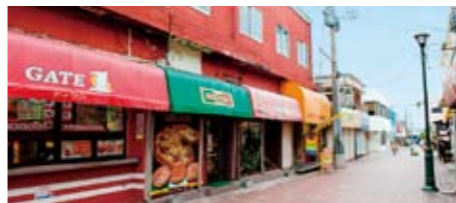
タコライス店が並ぶ町の飲食店街「新開地」

りを平成十九年に実施。好評を博した同イベント、次はギネスに挑戦しよう、平成二十一年に第二回目を実施して、見事、ジャンボタコライスの完成に至ったのですが、ギネス記録にタコライスのカテゴリーがないという衝撃的な事実遭遇。しかし、町内子どもたちに「世界一実現の夢」を与えたいと願った商工会では、ギネス協会へ何度もカテゴリー申請を行い続けました。そして、これから挑戦者が出てくるカテ