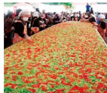
ギネス挑戦当日。町内のタコライス各店の皆さん、商工会の青年部・女性部の皆さんも大忙しでサポート

そして、出来上がったタコライスをギネス協会から派遣された認定員の立会いのもとに計量し、七百四十六キログラムのジャンボタ