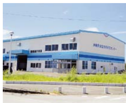
素形材産業賃貸工場 (金型技術研究センター)

同一形状の製品(部品)を大量に生産する時に使用するツールです。私達の生活の身近にある自動車、携帯電話などにも、金型を使った部品が多く用いられています。