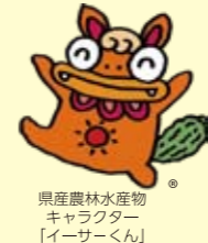
県産農林水産物キャラクター「イサーくん」

島ヤサイを使ったオリジナル料理レシピを提案する「うちなー島ヤサイコンテスト」の入賞作品の展示・試食