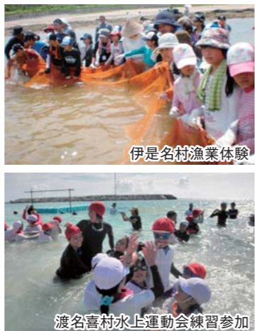
伊是名村漁業体験

有人離島の中で、最北端は伊平屋島、最南端は波照間島、最東端は北大東島、最西端は与那国島となっております。沖縄県の離島は、最東端から最西端までが約千キロメートル、最北端から最南端までが約四百キロメートルと、おおよそ本州の三分の二に匹敵する広大な海域に点在しています。