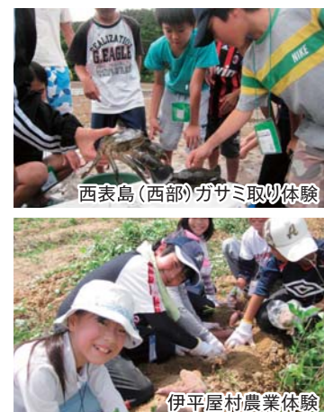
西表島(西部)ガサミ取り体験

近年では、大学生による大麻栽培事件や会社代表による覚せい剤精製事件などが発生しています。○薬物乱用は、本人だけでなく、周りのみんなも不幸にします