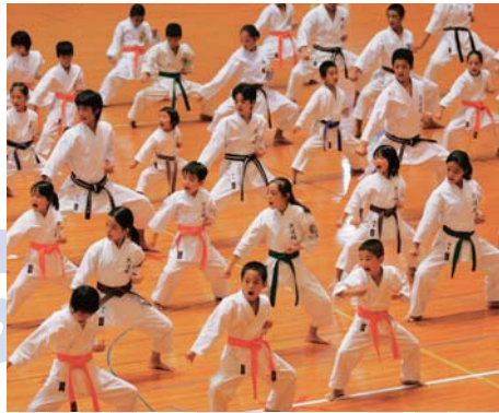
空手道・古武術交流祭(14日~15日)

まず沖縄セルラースタジアム那覇における「チャンプルー交流祭」。海外及び県内の方々が参加・交流できるステージイベントです。 また、スタジアム周辺では、世界各国の珍しい食べ物や伝統工芸などが勢揃いする「ワールドバザール」が始まります。十六日まで開催されますので、各国の多種多様な文化をお楽しみください。 沖縄コンベンションセンターに