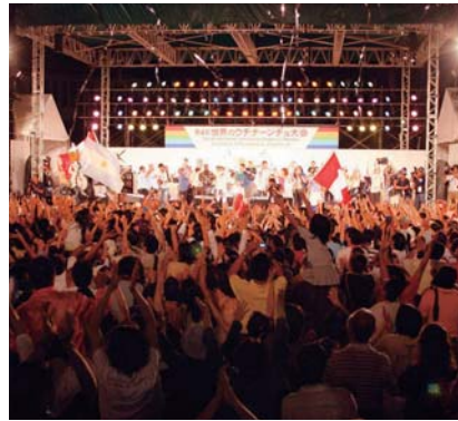
グランドフィナーレ(16日)