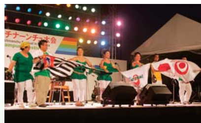
チャンプルー交流祭(14日~16日)

「大会概要」 一九九〇年の第一回大会から約二十年。今年五回目の節目を迎える今大会は、海外から大会史上最大五千人の参加を見込んでいます。 今回は、大会史上初、屋外での開会式・閉会式となります。会場は収容人数約三万人と県下最大規模を誇る「沖縄セルラースタジアム那覇」にて、屋外ならではのアトラクションを盛り込み、盛大に開催します。どうぞご期待ください!