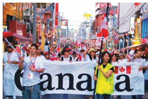
前夜祭パレード(12日)

お問い合わせ 第5回世界のウチナーンチュ大会事務局 TEL:098-866-2762 FAX:098-866-2328