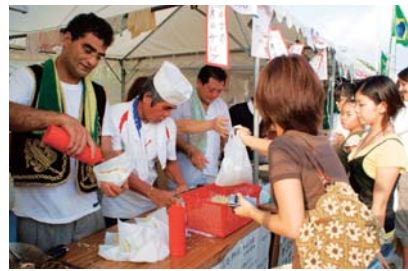
ワールドバザール(13日~16日)