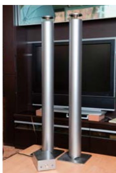
ノイズが少なくクリアな音が再現できる「全指向性スピーカー」

子どもの頃からラジコンづくりなどモノづくりが好きでした。現在は主にアンプを担当。切り出しから、組み立て、電流の調整、塗装までを一括して行い、ミスを犯さないことを心がけています。手掛けた製品をお客様に楽しく使ってもらい、「いい音だね」と喜ばれることがやりがい。お客様とのふれあい、コミュニケーションを大切にしていきたい。