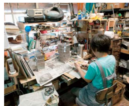
自社工場ではアンプの土台からすべて手作業で組み立て

昭和五十五年に開発された世界初のパワーアンプは、国内トップメーカーに先駆ける画期的なものでした。通常、低音から高音まで作り出すために、オーディオは三つ以上のスピーカーをハンダ接続します。しかし知名さんは、このハン