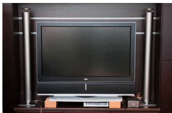
テレビにもつなげられるスピーカーとアンプのセット